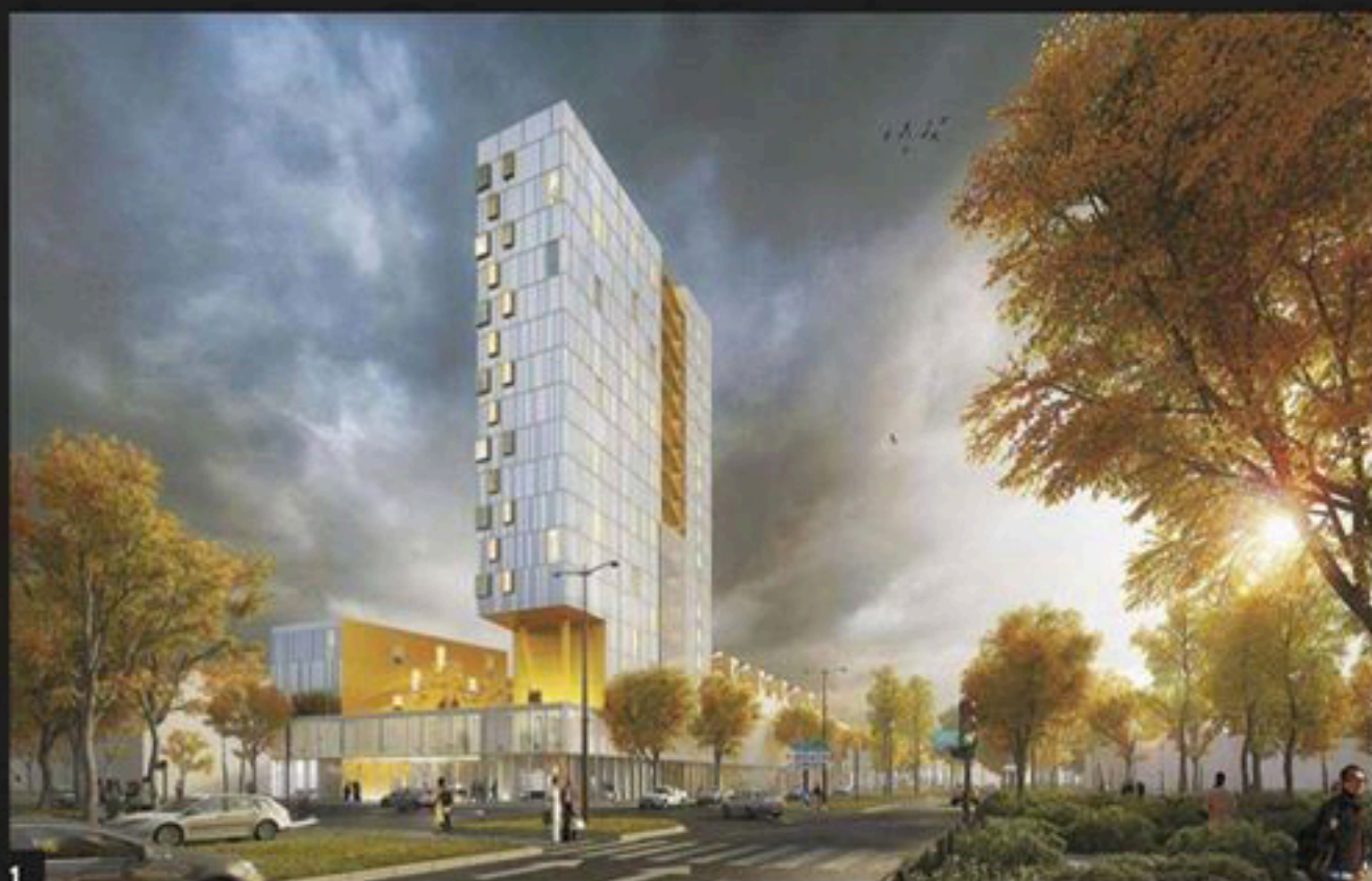
1. A l'angle des deux avenues, la tour est sculptée par un spectaculaire porte-à-faux qui participe, « par le vide », à la lecture du socle à R+4. La résidence pour étudiants est distribuée par le nord et tous les logements sont orientés vers le nouveau cœur d'îlot. 2. Au sud, la ZAC Normandie-Saumurois accueillera trois autres ensembles de logements à R+4 ou R+5 (lots B, C et D).

Le projet L'opération ne se distingue pas par la hauteur, qui n'est pas nouvelle dans le quartier, mais par sa mixité. L'enjeu est donc de faire cohabiter des fonctions variées dans un objet simple. Le projet offre lumière et tranquillité aux logements pour étudiants et une forte visibilité au socle, ancrage du nouvel ensemble. Les façades sont habillées d'un camaïeu de blancs en dégradé vers le ciel. Déclinée en une résille plissée, cette même façade ceinture les premiers niveaux. Le socle est organisé autour d'un patio baigné de lumière naturelle et investi par le paysage. Tous les logements sont exposés plein sud et orientés vers la ville historique. Leurs larges fenêtres favorisent les vues panoramiques.